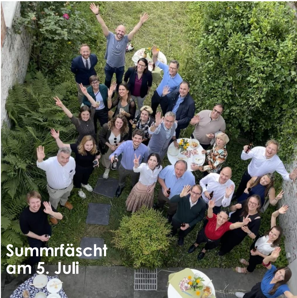
Summrfäscht am 5. Juli