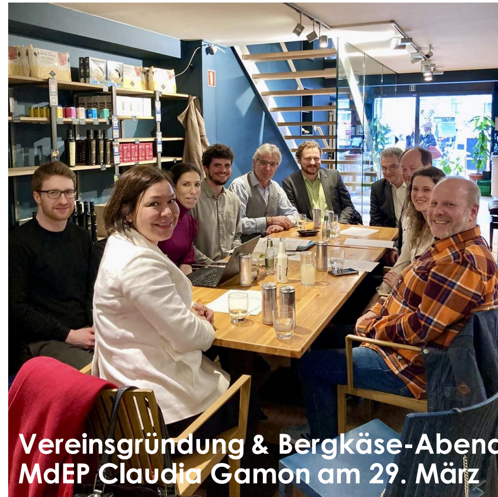
Vereinsgründung & Bergkäse-Abend MdEP Claudia Gamon am 29. März