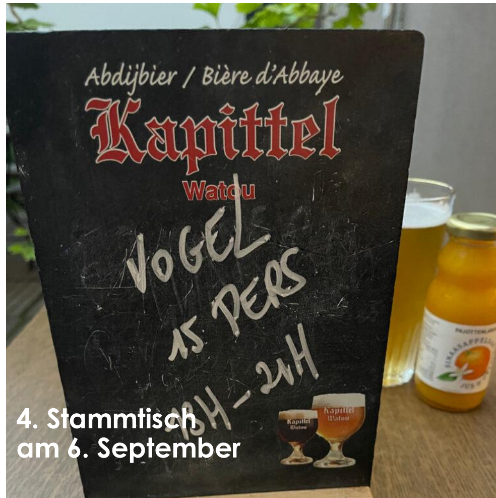
4. Stammtisch am 6. September