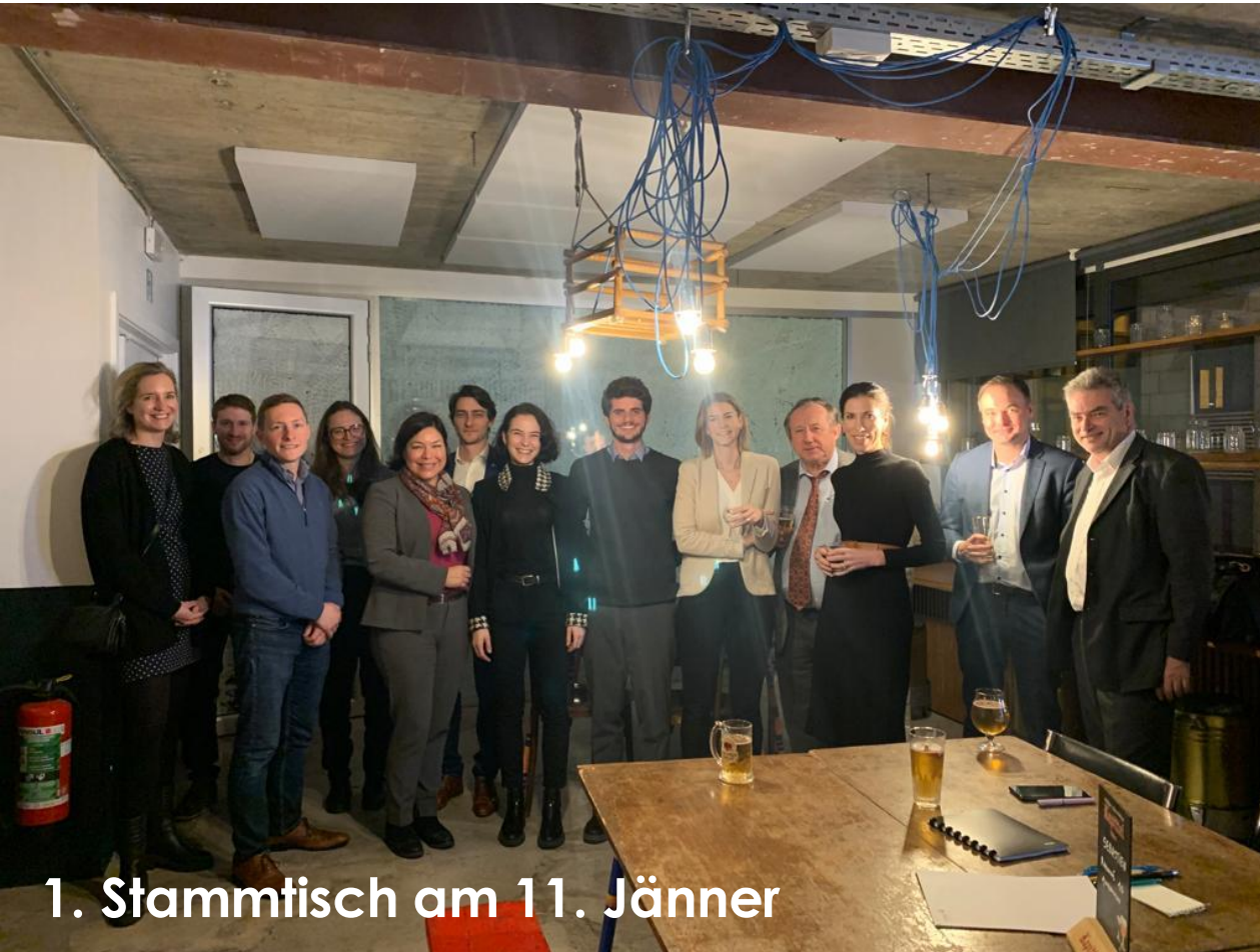
1. Stammtisch am 11. Jänner