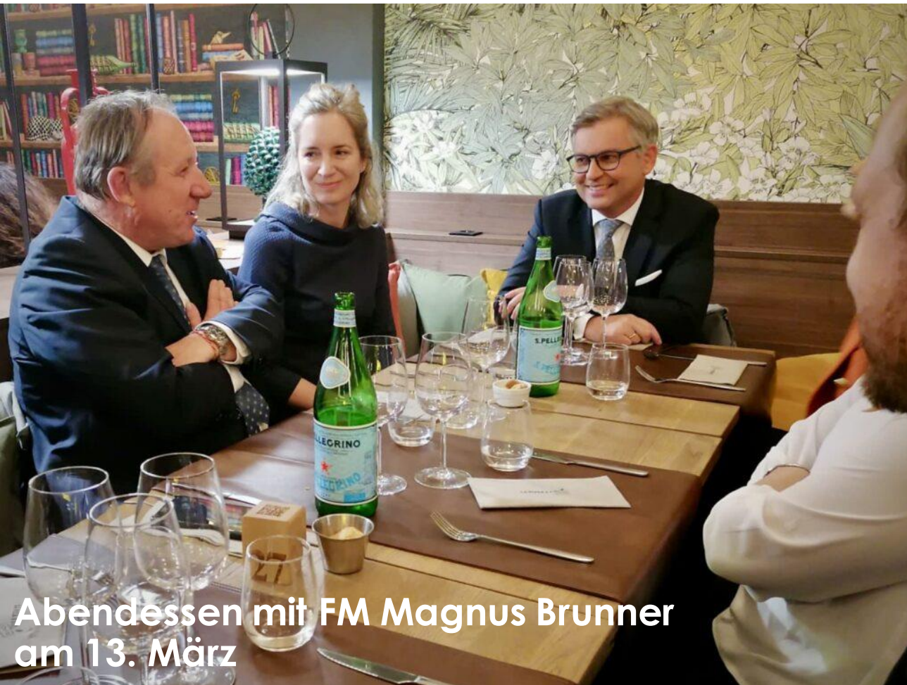
Abendessen mit FM Magnus Brunner am 13. März