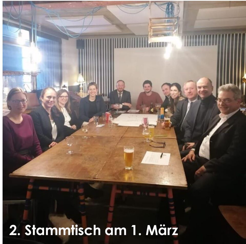
2. Stammtisch am 1. März